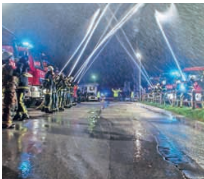
Takole so jih na dan povratka iz ZDA pričakali kolegi gasilci iz PGD Begunje.