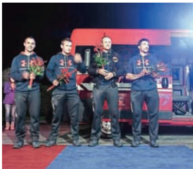
Navdušen pozdrav domačinov in prijateljev ob prihodu v Begunje.