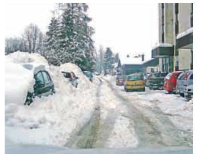
Zimske razmere v strnjenih naseljih februarja lani

V času obilnejših snežnih padavin se moramo zavedati, da ni mogoče zagotoviti pluzenja na vseh površinah hkrati, saj pluzenje poteka po izvedbenem programu zimske službe. Prebivalcem svetujemo, da se odpravijo na cesto samo takrat, ko je to nujno potrebno. V prometu bomo takrat imeli odlično priložnost, da s strpnostjo in uvidevnostjo dokažemo svojo kulturo.