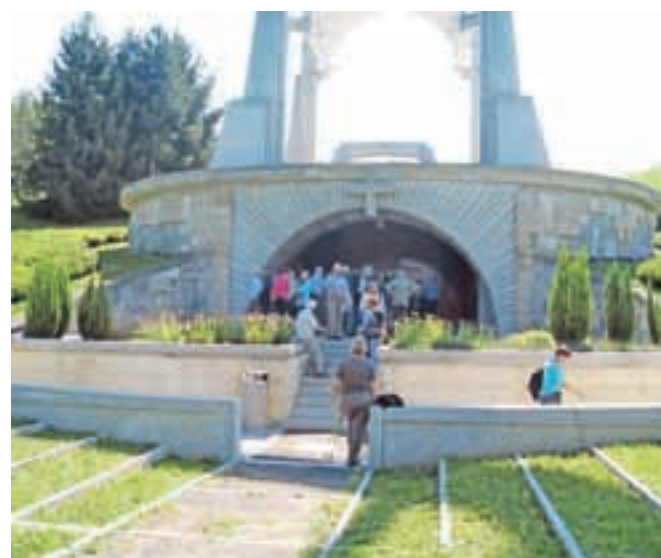
Člani društva so obiskali Teharje.