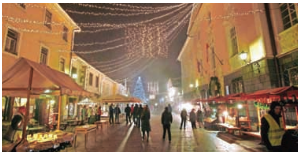
Ves december bo v Radovljici posebej slovesno.