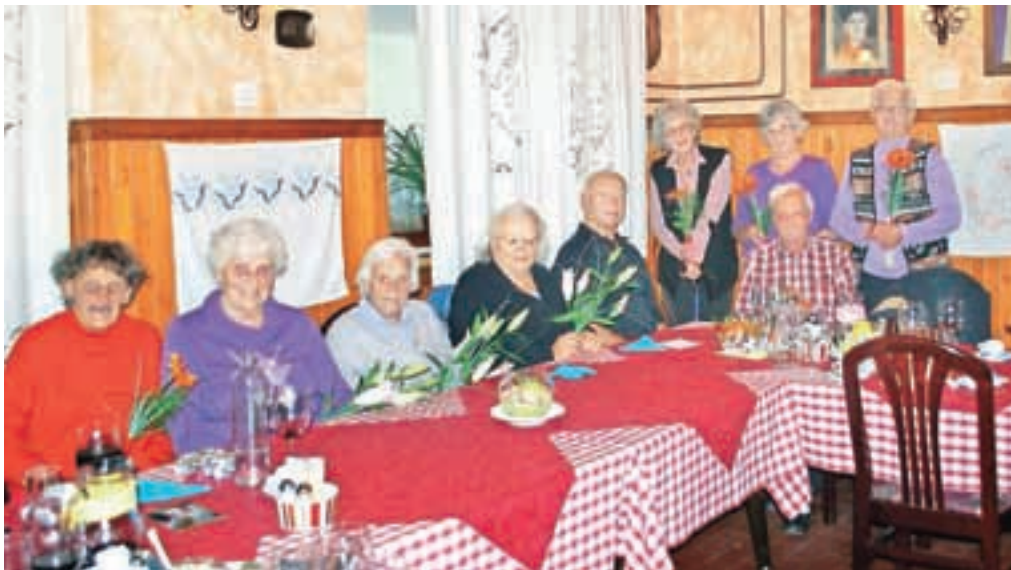
Letošnji jubilanti in jubilatke DU Kropa

nje ob dobri domači hrani in zvokih harmonikarja iz Kroppe Maksa Pogačnika. Sicer pa je kroparsko DU zelo aktivno. Vsak mesec organizirajo pohode. Letos so bili v Tamarju, na Lisci, Dednem polju, Javorniškem Rovtu ter na Dražgoški gori. Radi hodijo na izlete, letos jih je pot zanesla na trgatve na Dolenjsko. Večkrat so se udeležili tudi raznih kulturnih prireditev drugih gorenjskih društev. Bili so gostje prireditve Mlajši za starejše na občinski ravni, kjer so sodelovale šole iz Občine Radovljica. Društvo je organiziralo tudi prstomet na občinski ravni, maja pa so svojim članom na Letnem kopališču Kropa priredili piknik. Člani DU Kropa se radi udeležujejo tudi športnih prireditev, kjer so največ uspehov zabeležili v kegljanju.