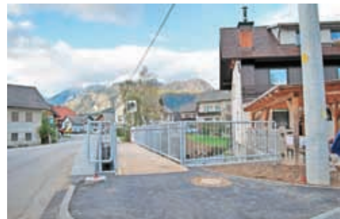
Most je zdaj vendarle varen tudi za pešce.

Stroške izdelave projekta je nosila Občina Radovljica, stroške izvedbe v višini 30.000 evrov pa bo pokrila krajevna skupnost. »To je primer, kako se lahko z dobrim sodelovanjem uspešno izvede projekt, ki je bil nujno potreben,« je bila ob odprtju zadovoljna predsednica. Še vedno pa ostaja odprto vprašanje izgradnje pločnika proti avtobusni postaji, ki pa bo zaradi ozkega prehoda ob cesti večji problem.