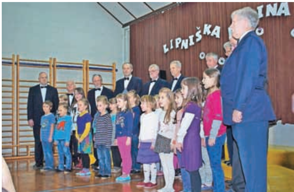
Na OŠ Staneta Žagarja Lipnica so organizirali dobrodelno pevsko prireditev.

Na prireditvi, ki je potekala drugo leto zapored, so tokrat