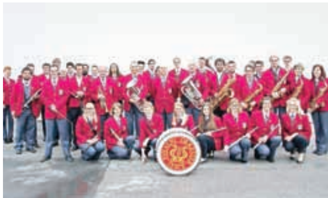
Pihalni orkester Lesce je na tekmovanju v Ormožu prejel zlato plaketo.